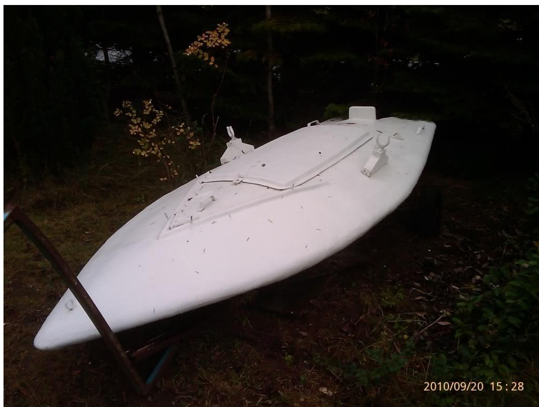
Glasfiber kopi af original træ langelænder.

Sideløbende med de fabriksfremstillede Langelandspramme vedblev der privat at blive bygget lokale pirat "langelands pramme". Nogle tog udgangspunkt i de originale Rudkøbingpramme og fik rund samling og firkantet mandehul, i stedet for fenderliste som på fabriksmodellen.