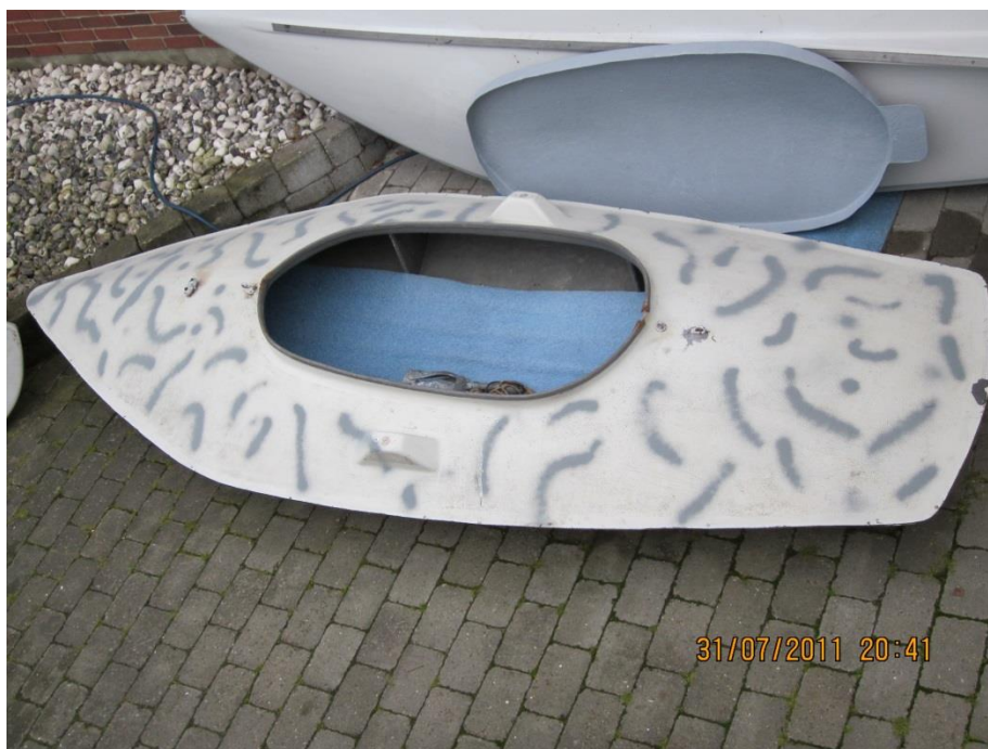
Langelænder fra 1980'erne bemærk mandehullets form.

I Horsens området var der tradition for at drive hvinandejagt på den åbne vandflade fra "Gran-hytter" d.v.s. robåde der blev camoufleret med grangrene. Langelandsprammen i glasfiberudgaven blev på de kanter modtaget med stor begejstring og fik en vis udbredelse.