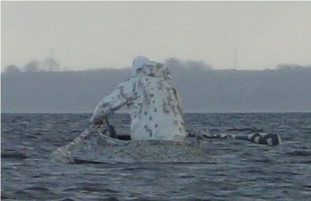
Langelænder i sit rette element en overskyet vinterdag på en dansk fjord.

Langelænderen i en anvendelig udgave er ikke længere i produktion og brugte pramme er vanskeligt at opdrive.