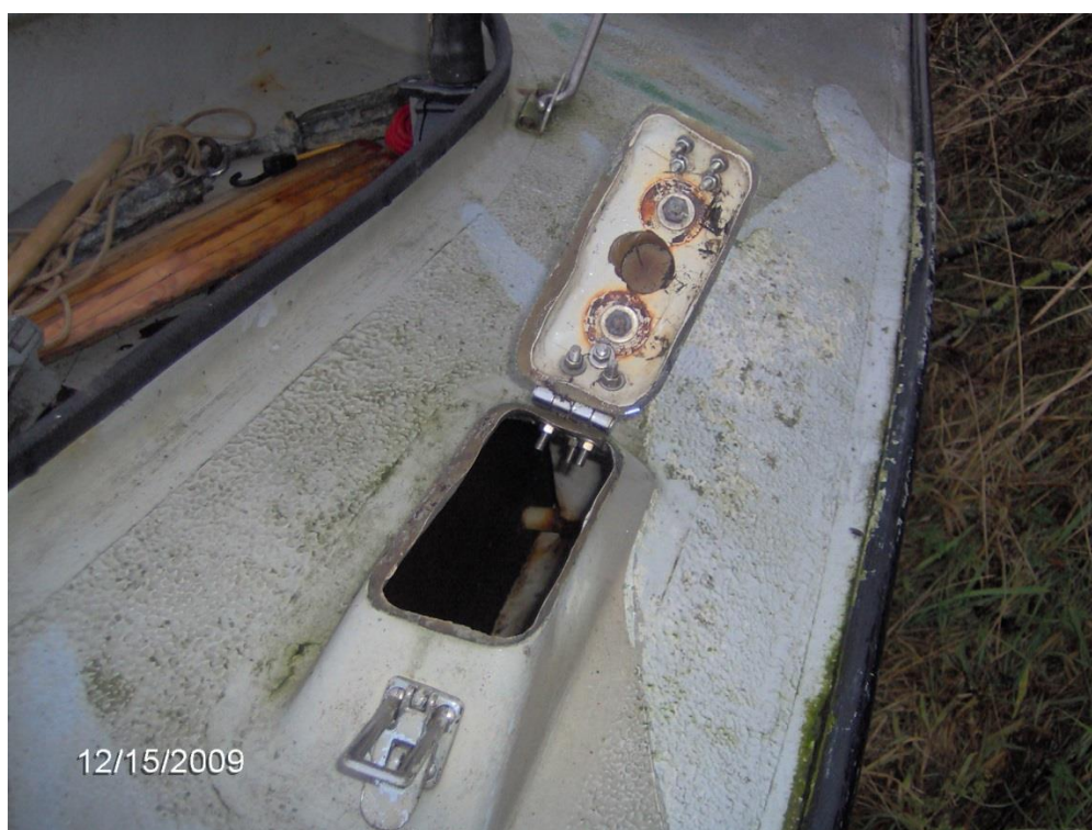
Vandindtag gennem åretollerne i en sænkelangelænder. Vandet føres til tanke langs ringdækket. Tankene læses gennem det samme hul.