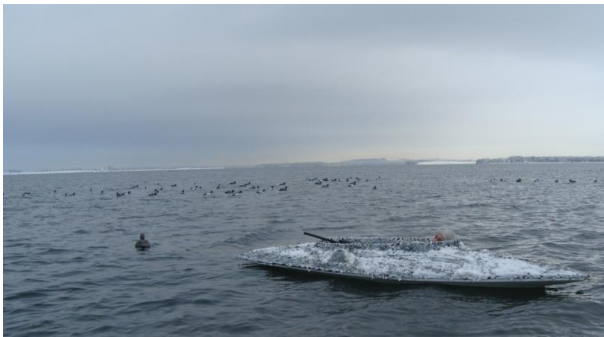
Moderne modificeret Langelænder" i sit rette element: Åbent lok efter hvinænder. Bemærk Jægeren der ligger dybt og godt skjult i denne lave pram.

Af mange grunde kan man som strandjæger ikke undgå at blive forelsket i den pram. Dette betyder bl.a. at det efterhånden er uhyre svært at skaffe en sådan pram – der kommer ganske simpelt meget sjældent pramme til salg.