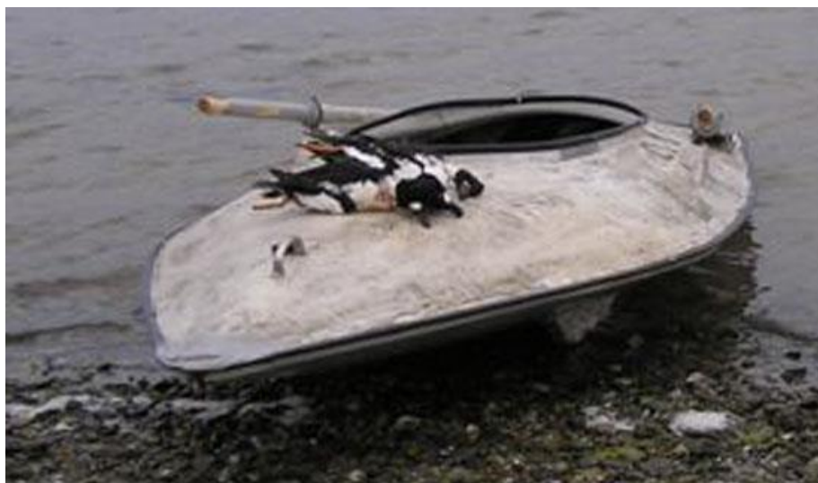
En af de Første fiber langelænder. De korte gængerkøle skimtes på fotoet.

agterenden op i vinden. Dette gav imidlertid problemer i søgang, idet bølgerne nemt løb op over agterdækket og ind i nakken på jægeren.