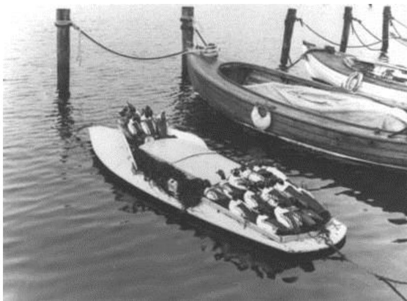
Rudkøbingpram med hvinande-lokkefugle. Rudkøbing havn 1958

Ved siden af sin virksomhed som urmager, finmekaniker og bøsse-mager, nåede Martin Christensen gennem årene at fremstille flere hundrede lokkefugle. Flest af