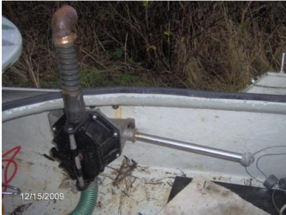
Membranpumpe i sænke langelænder, der anvendes både ved indtag og læsning af vandtankene.

Langelandsprammen har stået moder til et par andre pramme, hvoraf Stenderup prammen har samme overbygning som langelænderen.