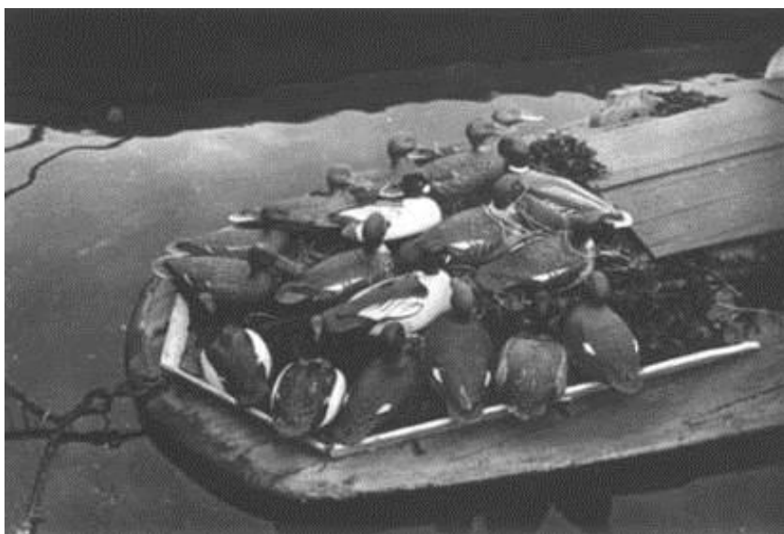
Foto af ældre "Rudkøbingpram" med håndskrånne lokkere på agterdækket.

Op igennem de første 3 årtier af 1900 tallet blev "Rudkøbing prammen løbende videreudviklet. Den danske udgave blev efterhånden mere spids i stævnen, blev bredere bagtil, fik fladere agterdæk, ligesom prammen blev mindre og lavere så den synede mindre under jagten. Prammene blev bygget som "Lærk-på-Eg".